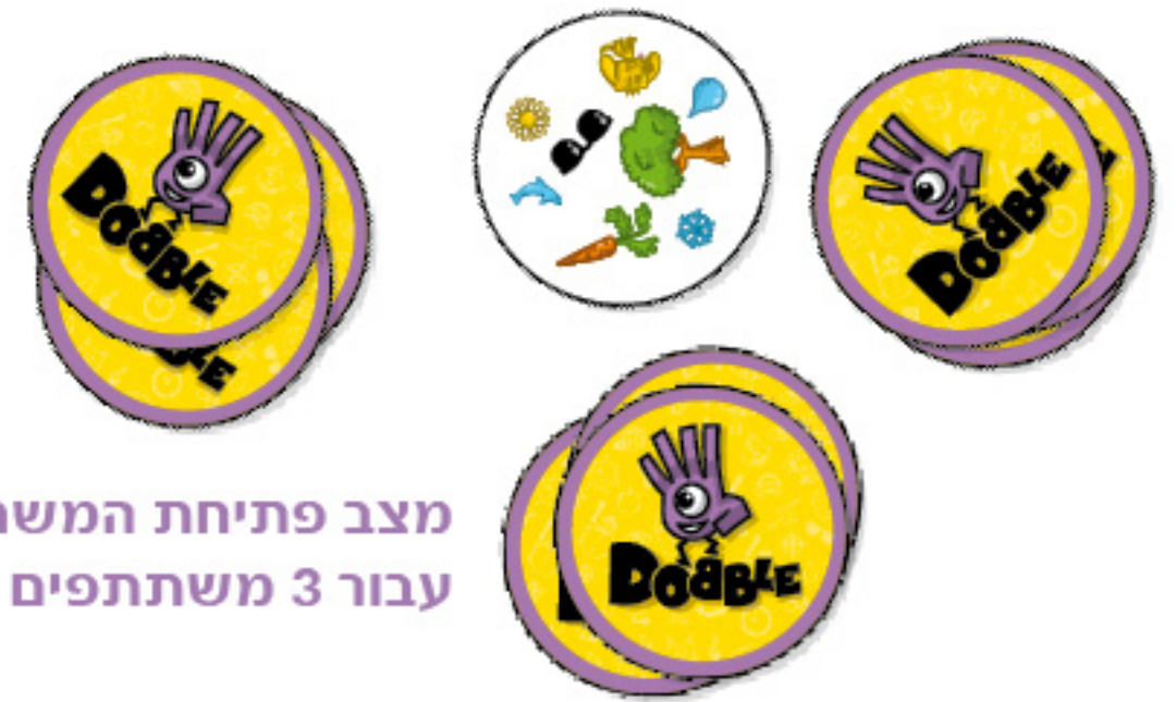
מצב פתיחת המשחק עבור 3 משתתפים