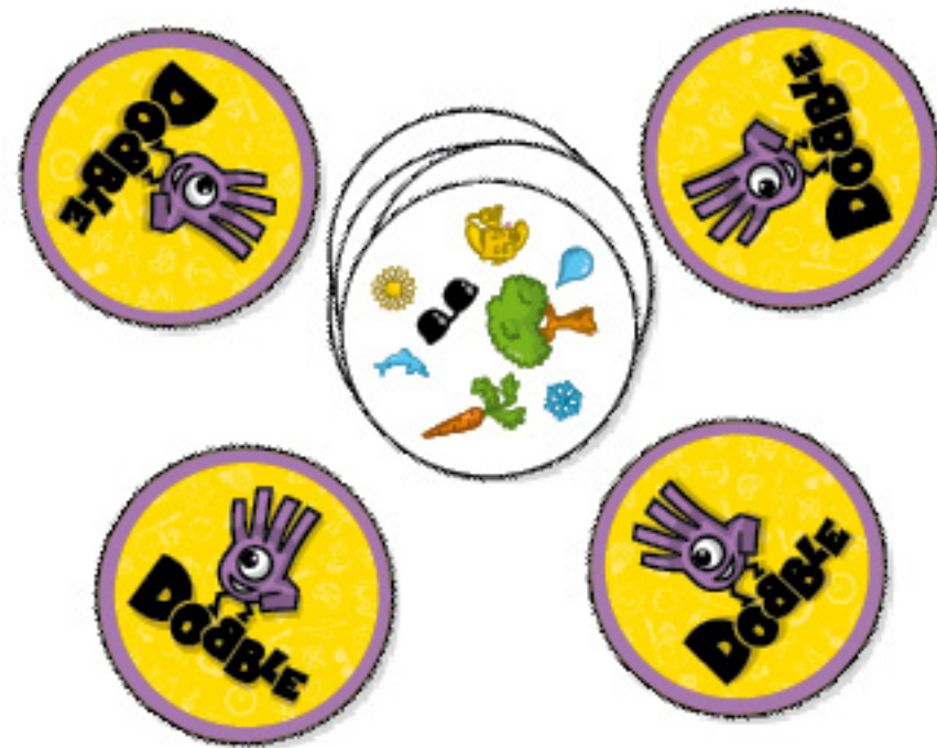
מצב פתיחת המשחק עבור 4 שחקנים